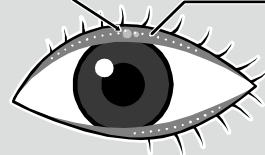
タピオカサイン マイボーム腺

ちなみに、油分はまぶたにあるマイボーム腺から分泌されますが、腺の出口が油で詰まると油分がきちんと分泌されず涙の質が低下してしまいます。もし、皆さんのまぶたの淵にポツンとしたニキビのようなもの、通称“タピオカサイン”があったら、それは詰まりのサインかもしれません。